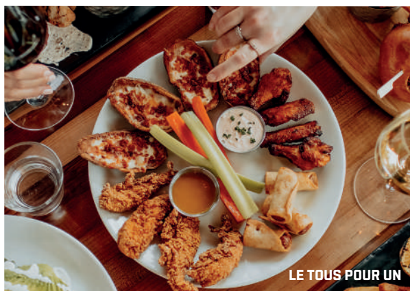
LE TOUS POUR UN