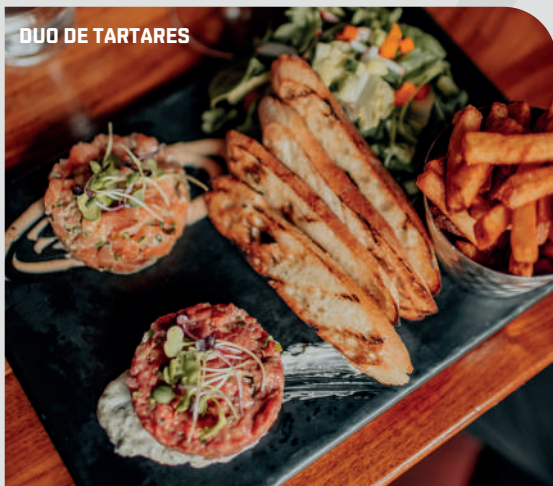
DUO DE TARTARES

Tartare de bœuf au couteau, crème montée ou tartare de saumon ou tartare de thon 23 90 €