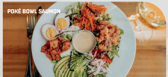
POKÉ BOWL SAUMON

🍌 VÉGÉTARIEN 🌶️ ÉPICÉ 🍷 SPÉCIALITÉ QUÉBÉCOISE Photos non contractuelles. Prix service compris.